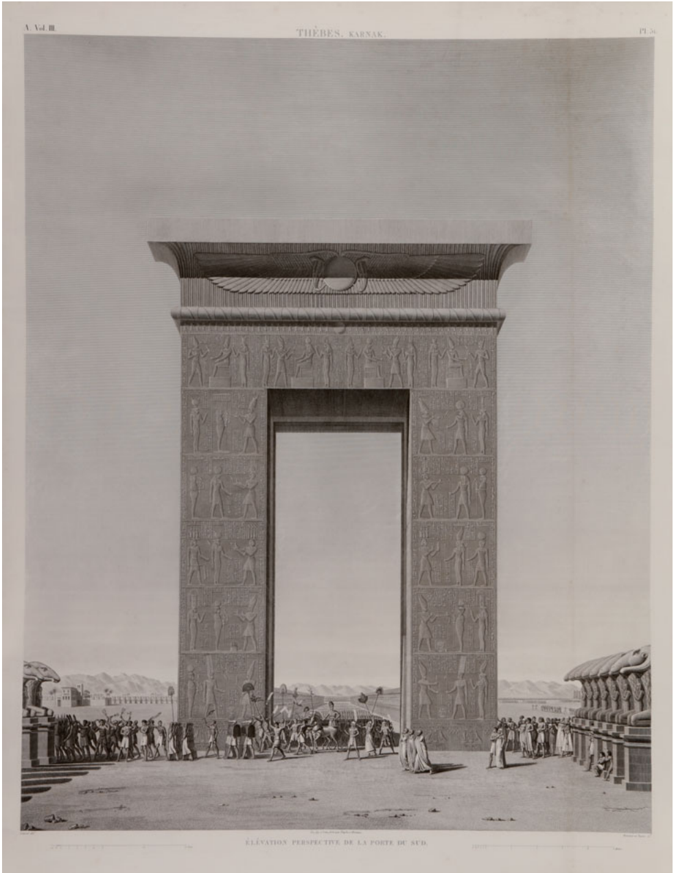
THÈBES, KARNAK. ÉLEVATION PERSPECTIVE DE LA PORTE DU SUD. DESCRIPCIÓN DE EGIPTO, 1809-1823, PARÍS.