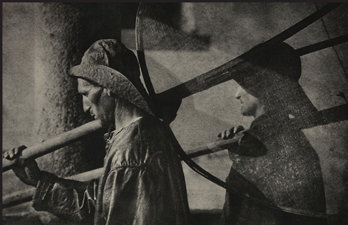
REMEROS VASCOS, 1924. JOSÉ ORTIZ ECHAGÜE