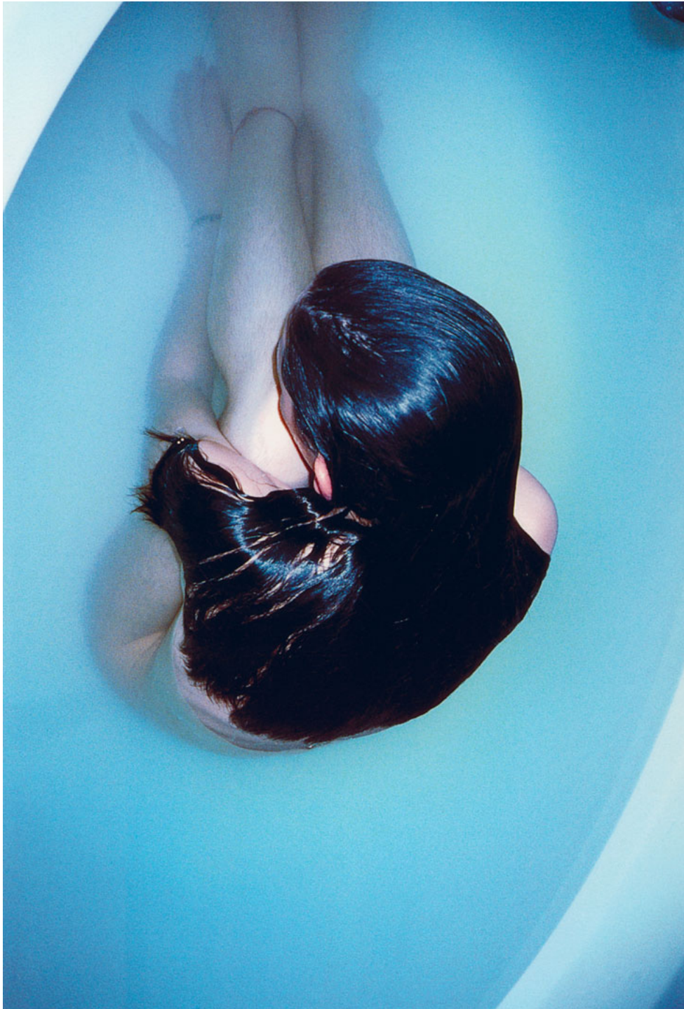
LUZ AISLADA. BATH. JUAN USLÉ