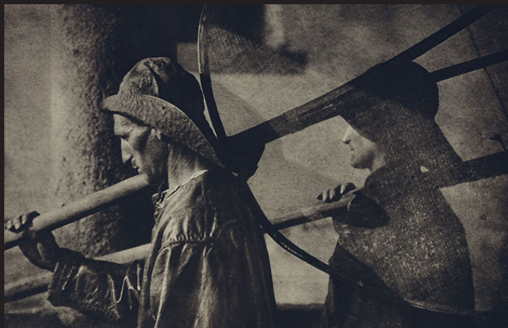
REMEROS VASCOS, 1924. JOSÉ ORTIZ ECHAGÜE

Este espacio, que se renueva anualmente, acerca la figura del fotógrafo José Ortiz Echagüe y muestra una selección de su obra, legada en 1981 a la Universidad de Navarra y origen del Fondo Fotográfico Fundación Universitaria de Navarra, hoy integrado en el Museo. De esta forma, se expone una selección representativa de la producción de este autor, clave en la historia de la fotografía española, que recoge las diferentes series en las que se articula su producción. Junto a estas imágenes, también se explica el procedimiento técnico que empleaba, el carbón directo sobre papel fresson, ilustrándose las fases del procedimiento técnico para hacer sus fotografías. Igualmente se muestra una selección de las publicaciones que editó mostrando sus obras, así como un vídeo biográfico que contextualiza su figura.