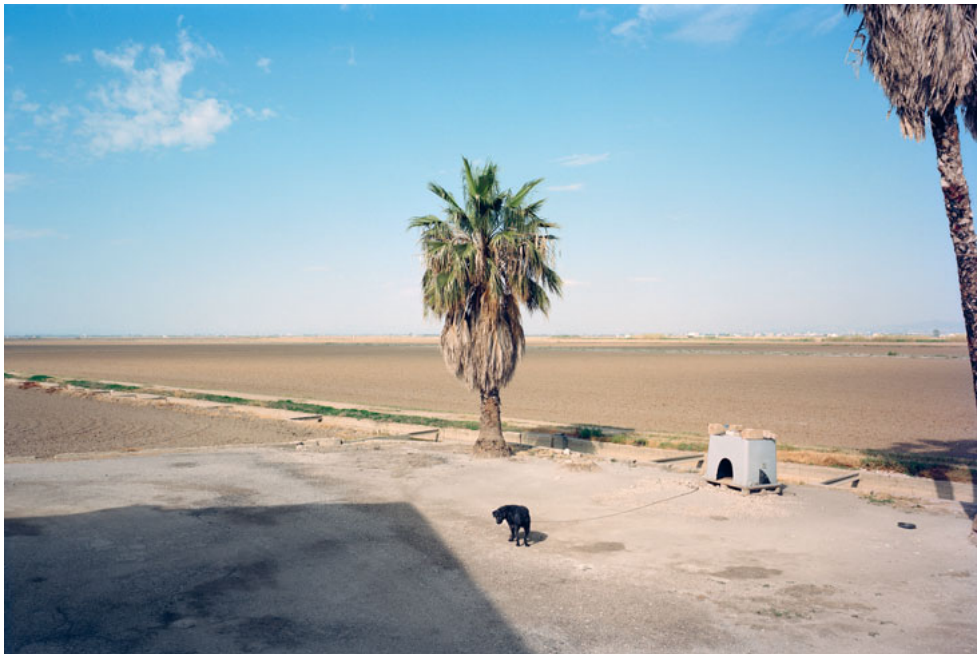
BARCELONA, MARZO DE 2021. THE WAITING GAME. TXEMA SALVANS. 2021