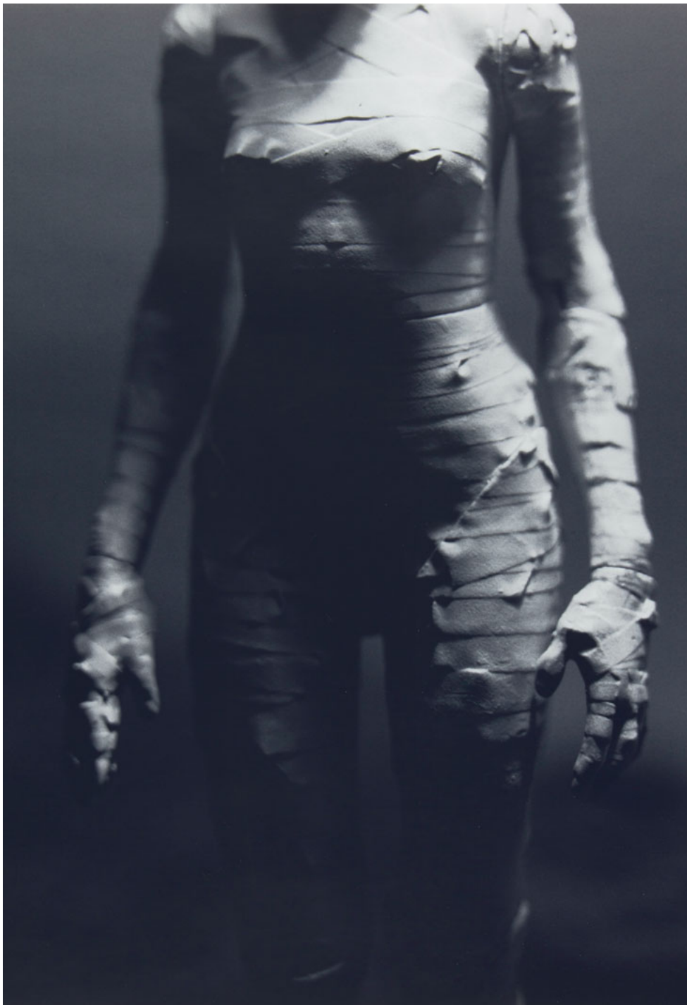
ELSA LANCHESTER NOVIA DE FRANCKENSTEIN