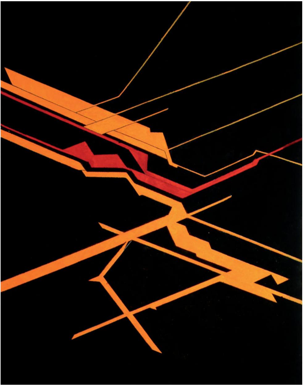
SYDUS. PABLO PALAZUELO. 1997. © FUNDACIÓN PABLO PALAZUELO, MADRID