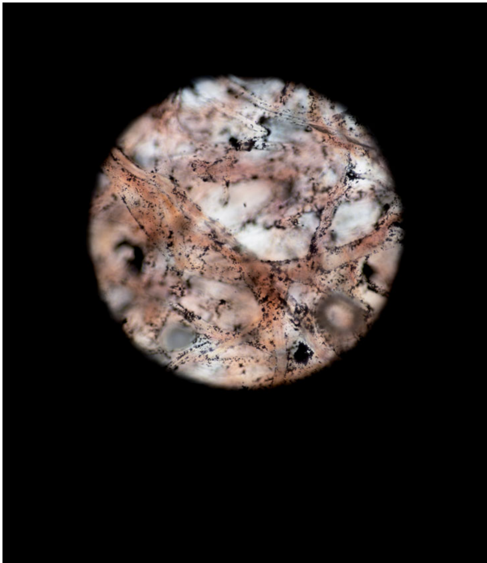
MICROFOTOGRAFÍA DE 200 AUMENTOS DE UN CALOTIPO CON LA IMAGEN DE LA FACHADA DE UNA CASA.