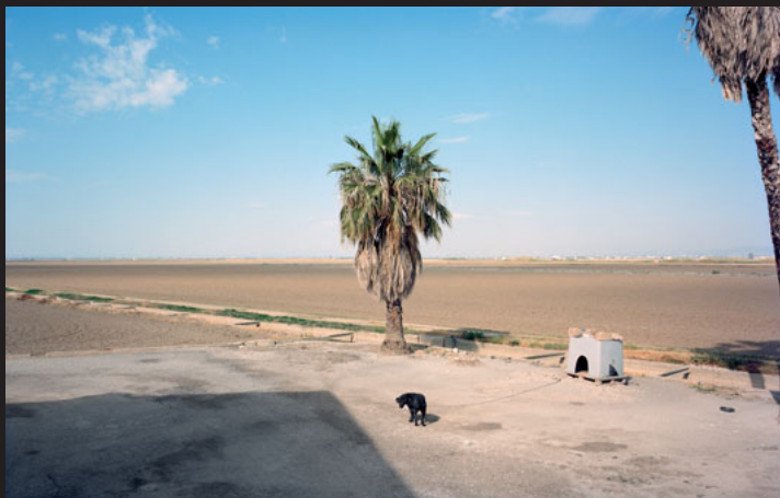
BARCELONA, MARZO DE 2021. THE WAITING GAME. TXEMA SALVANS. 2021