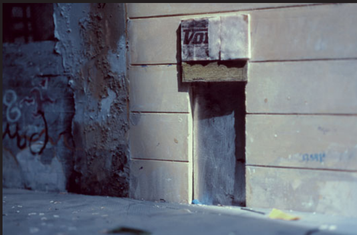
#587. CALLE CADENA CON SANT JOSEP ORIOL, 7 DE ABRIL DE 2000. DE LA SERIE "LA DALIA BLANCA". 2000.