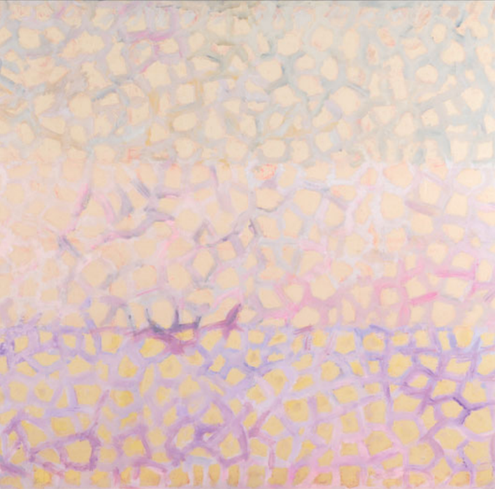
BANDERA BIS, [1982]. © JOSÉ LUIS ALEXANCO - VEGAP - PAMPLONA, 2022