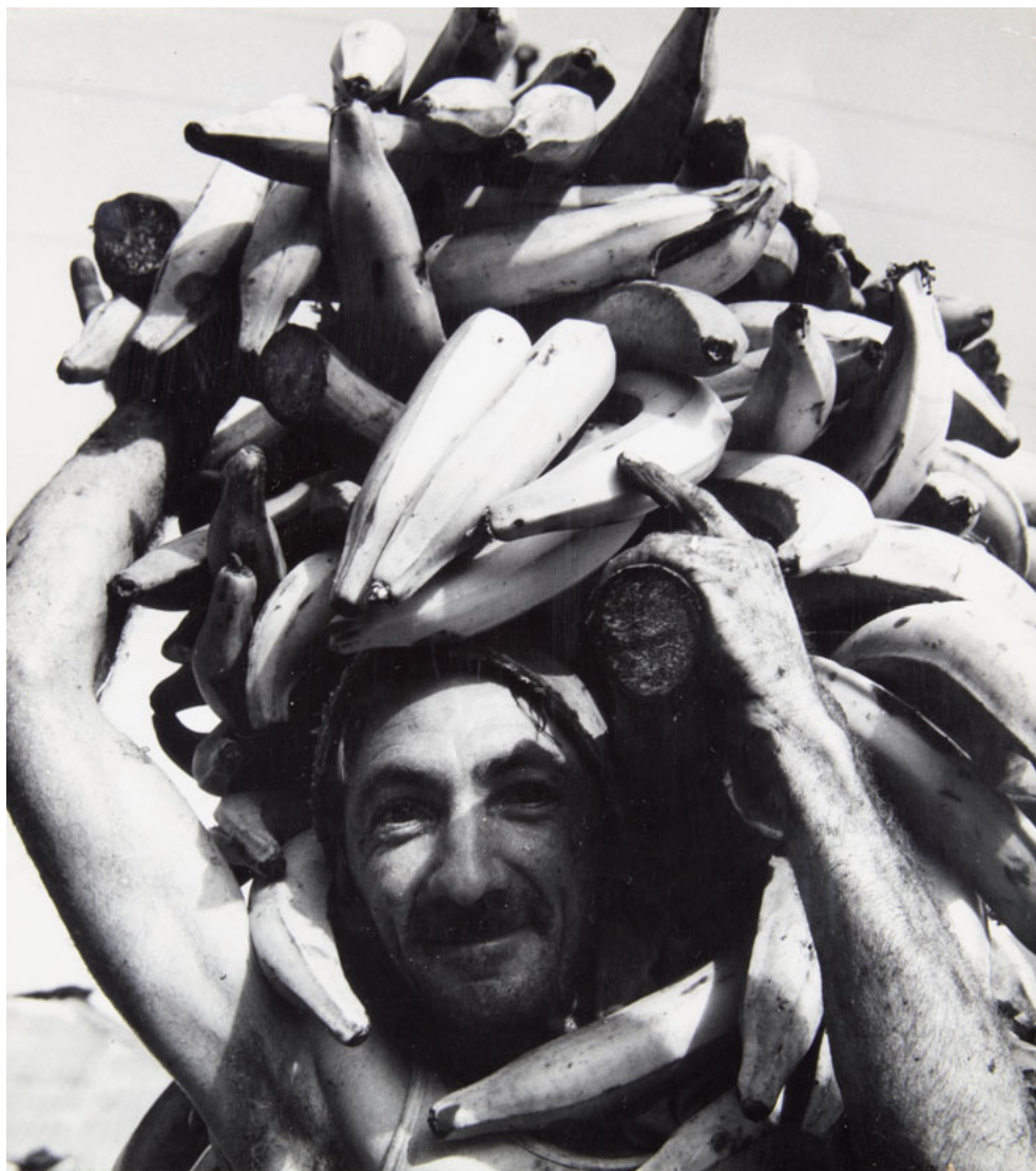
EL HOMBRE PLÁTANO. ARACATACA, COLOMBIA. 1949.